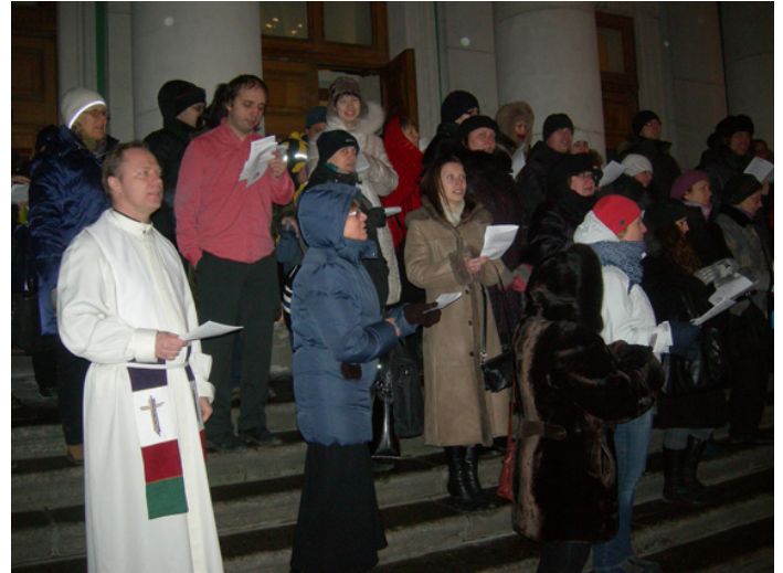
Jouluyö - juhlayö laulettiin Pyhän Marian kirkon portailla jouluaaton iltapalveluksessa.