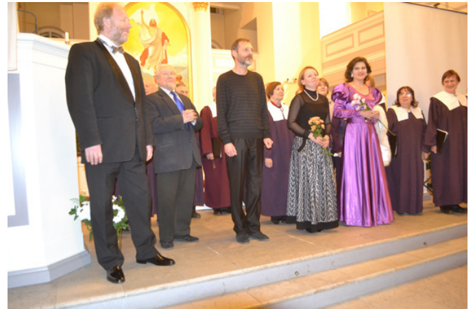
Peräkkäiset konsertit 13.1. ja 14.1.2013 vetivät kirkon täyteen väkeä.