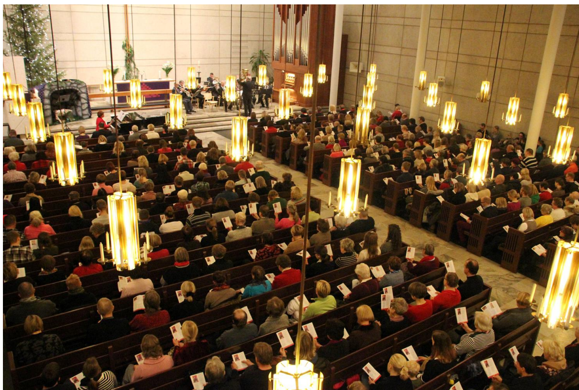
Kauneimmat joululaulut kaikuivat täpötäyden kirkkoväen toimesta jouluna 2012.

Lauttasaaripäivänä järjestettiin urkuesittely ja mahdollisuus soittaa urkuja parvella teemalla Urku auki! Mukana oli seuran puheenjohtaja Ville Elomaa.