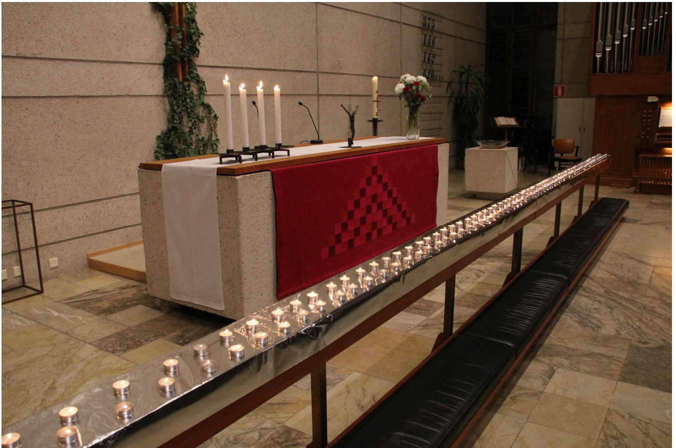
Pyhäinpäivänä 2012.

Kirkolliset toimitukset: Lauttasaaren seurakuntaan kastettiin 154 jäsentä, kuolleita oli 122 ja kirkollisia vihkimisiä 65.